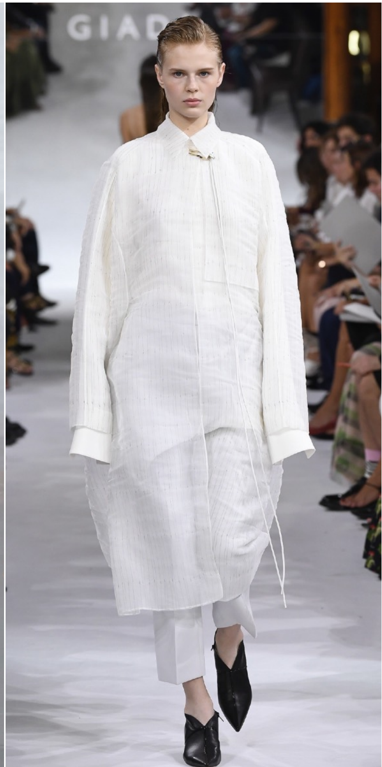
ALEXANDER MCQUEEN | BALMAIN | GIADA