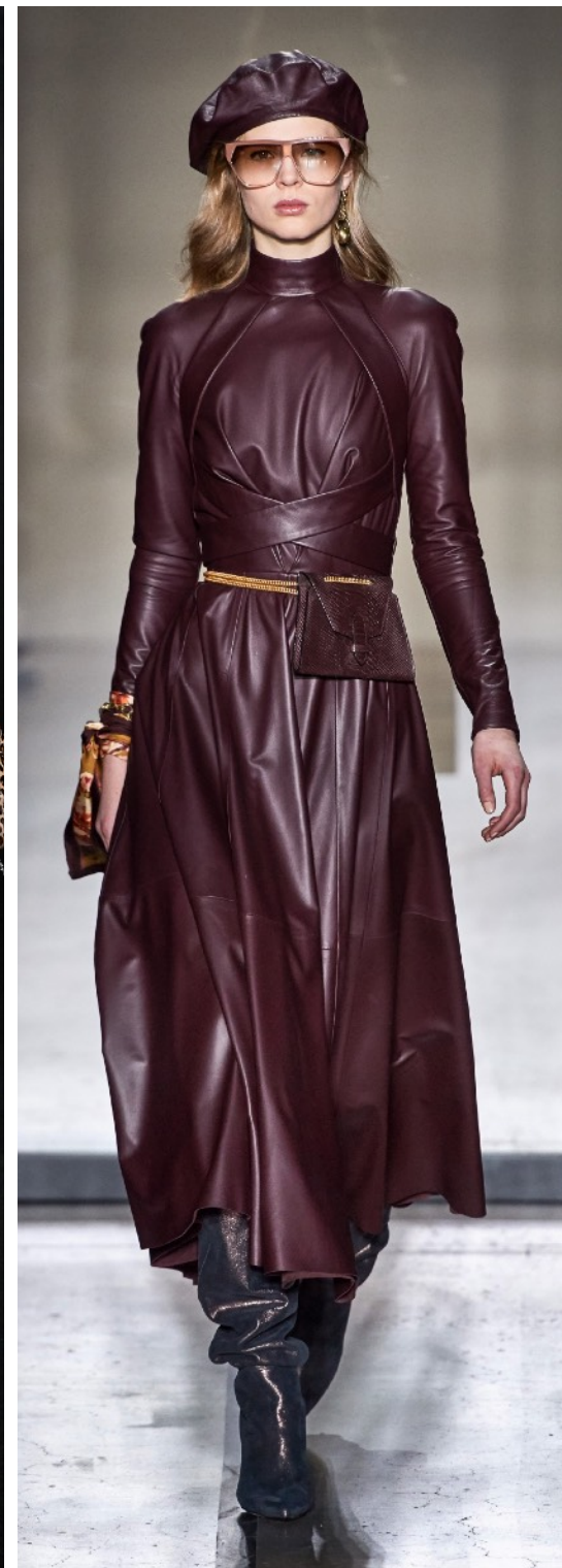
BALMAIN | BLUMARINE | ZADIG&VOLTAIRE | ZIMMERMANN